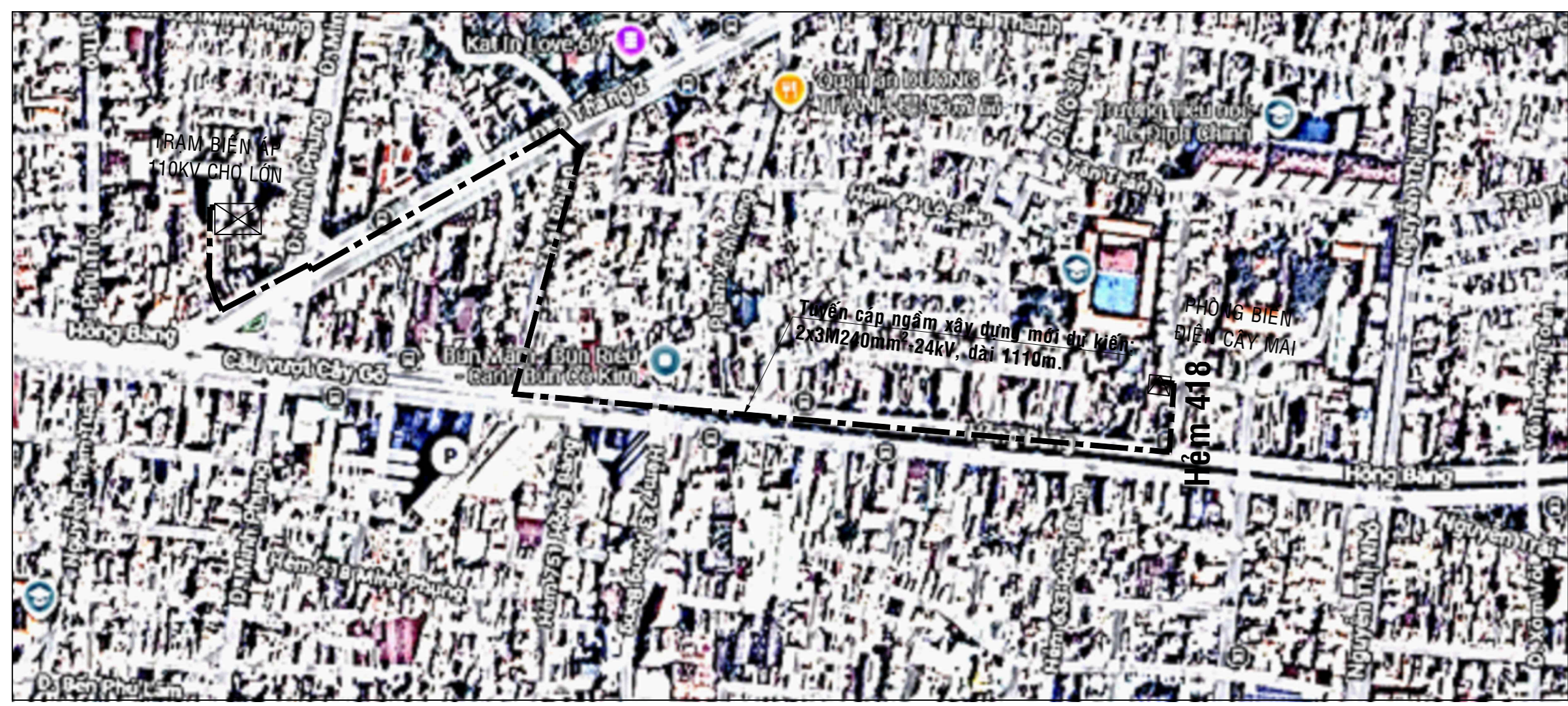
HỌA ĐỒ VỊ TRÍ